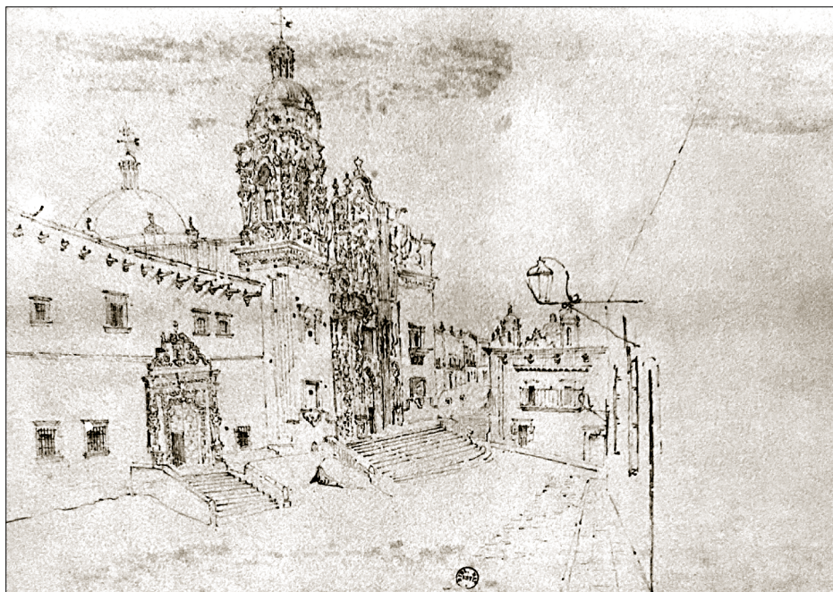
Convento y Templo de San Agustín. Dibujo del Dr. Philippe Ronde, 1850. Fuente: Sescosse, Federico, "Zacatecas a vuelo de pájaro", en Artes de México , núm. 194-195, México, Litográfica Torres y Rosas S.A., 1960, p. 26.

las propiedades. El caso sirve para ejemplificar las operaciones simuladas: se le adjudica una propiedad a una particular, y éste funge como dueño provisional del bien inmueble, siendo que el beneficiario directo seguía siendo la institución religiosa. 36