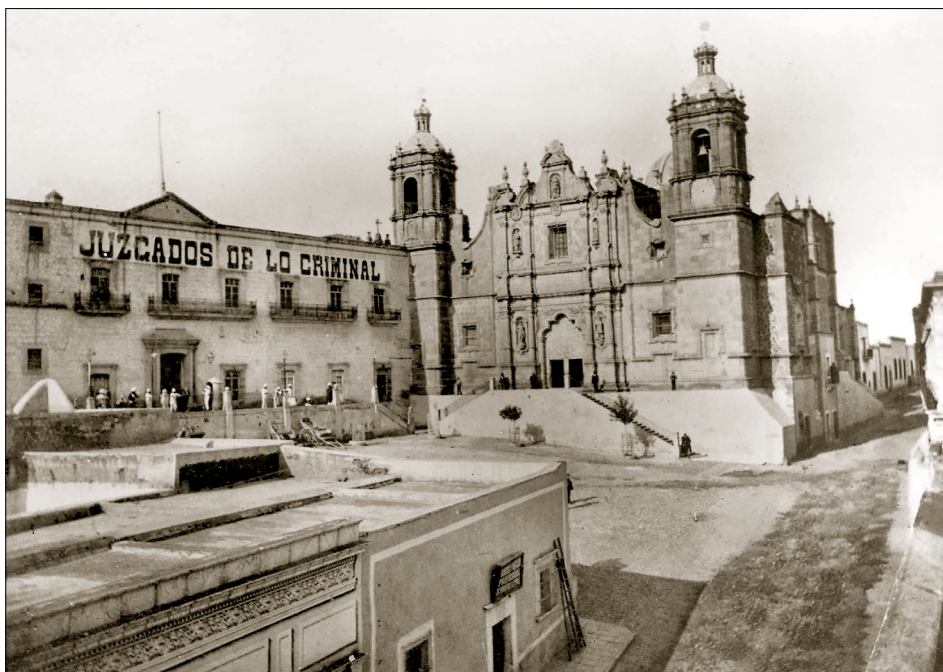
Imagen: Plazuela de Santo Domingo, 1880.

Con la Ley de Nacionalización de Bienes Eclesiásticos, el ayuntamiento de Zacatecas vio la oportunidad de hacerse con el convento de los dominicos y así ahorrarse el pago de la renta. Dado que la situación de las órdenes religiosas no les permitió negociar, aunado al empuje que el gobernador del estado J. Jesús González Ortega tenía sobre hacer cumplir la nacionalización, los dominicos no tuvieron alternativa más que dejar su convento. Por su parte, tanto el ayuntamiento como el gobierno del estado se beneficiaron de esta acción, puesto que yo no tenían que asignar presupuesto para arrendar el inmueble, y, contrario a lo que paso con otras edificaciones, el convento no fue puesto en venta para fomentar la creación de pequeños propietarios, sino que su nacionalización obedeció a aliviar la situación financiera del ayuntamiento de Zacatecas.