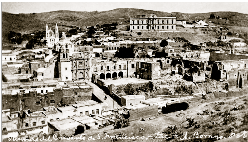
Imagen: El ex convento de San Francisco.

Una posible ruta de explicación acerca del por qué este complejo conventual no fue poseído por autoridades civiles o bien, puesto en venta, fue el estado ruinoso en que se encontraba, aunado a que no hubo algún proyecto de lotificación y que, en años posteriores, los franciscanos volvieron a ocupar el espacio y dedicarlo nuevamente a actividades de culto público.