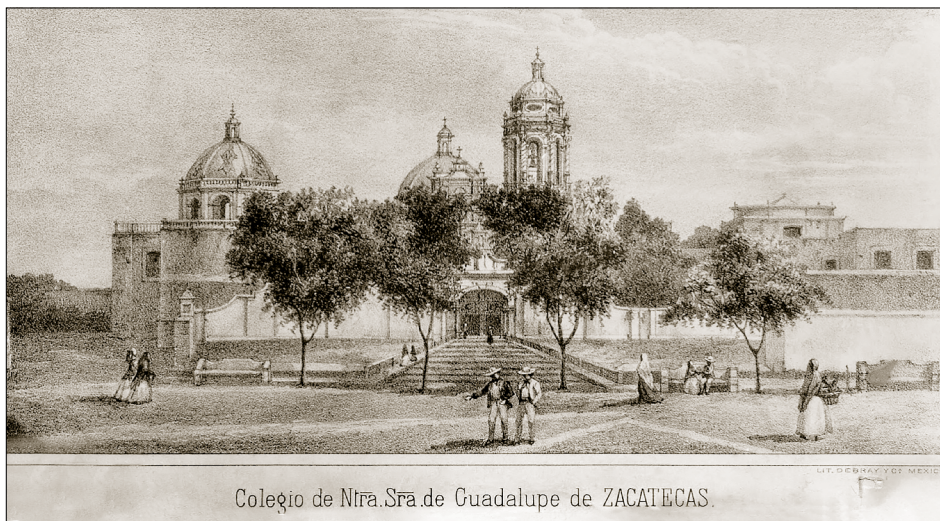
Imagen: El Convento de Guadalupe de Zacatecas. Litografía de finales del siglo XIX.

franciscanos, mientras que lo restante fue ocupado por el gobierno del estado de Zacatecas. La exclaustación de la orden ni representó el fin de su presencia, pero sí existieron cambios sustanciales. Si bien la comunidad sí pudo regresar al Colegio, tuvo que adaptarse a las nuevas circunstancias, como la “limitación en el número de religiosos, el acopio de nuevos libros de su biblioteca y, no menos importante, la obligatoria convivencia con las instituciones estatales dentro del mismo espacio, llámese Escuela de Artes y Oficios, Hospicio de Niños u Hospicio de Niñas.” 48