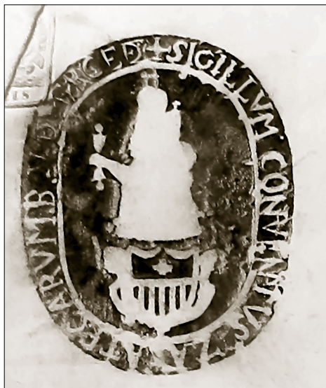
Imagen: Sello de la orden agustina en Zacatecas.

La entrada en vigor de la Ley Lerdo en 1856 no supuso inicialmente grandes problemas para los mercedarios, quienes se encontraban más preocu-