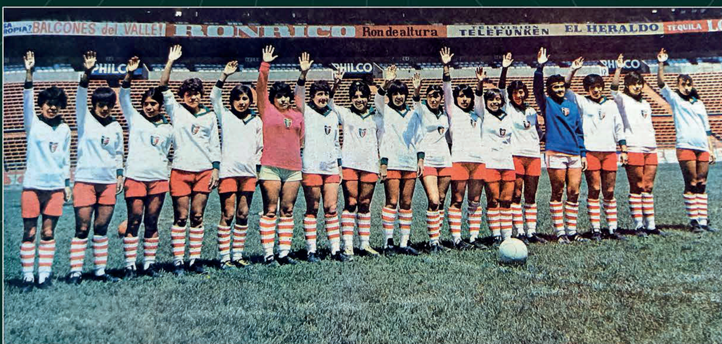
Selección mexicana de fútbol. El Heraldo de México , 15 de agosto de 1971, p. 1-B. Hemeroteca Nacional-UNAM.