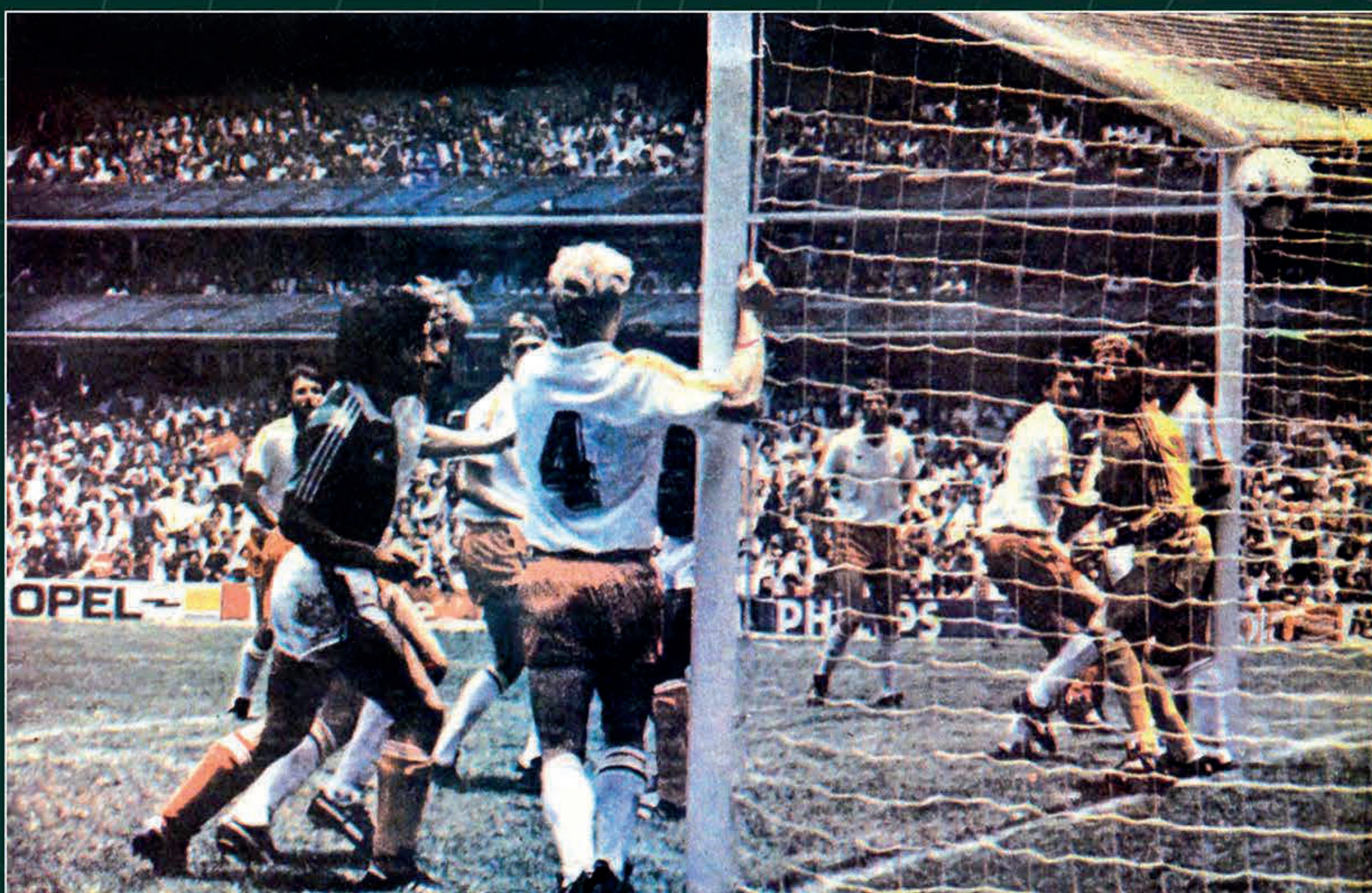
"Otro triunfo sobre Bélgica, ahora 2-1", El Heraldo de México , 4 de junio de 1986. Biblioteca Miguel Lerdo de Tejada.

El torneo tuvo claroscuros individuales para su máxima figura, Hugo Sánchez, quien pese a anotar en el debut, sufrió un marcaje asfixiante y falló un penal decisivo ante Paraguay. El sueño mundialista del "Tri" concluyó finalmente en Monterrey, donde tras un intenso duelo de 120 minutos, la selección fue eliminada en penales por Alemania Federal.