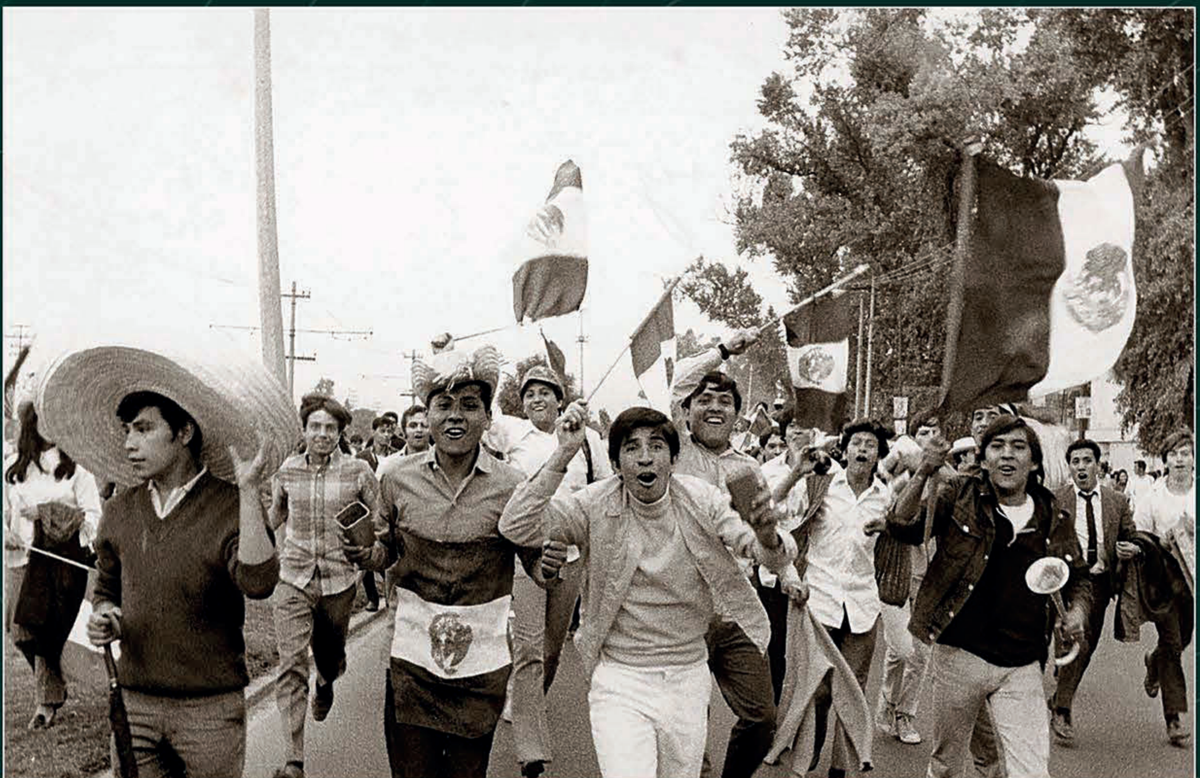
Monroy, foto. Cientos de aficionados festejando el triunfo de México. 11 de junio de 1970. Archivo Gráfico de El Nacional , Fondo Temático, Sobre: FUT-DD (017) SECRETARÍA DE CULTURA.INEHRM.FOTOTECA.MX.

"México avanzó a cuartos de final ganando a Bélgica 1-0", Ovaciones , 11 de junio de 1970. Biblioteca Miguel Lerdo de Tejada.