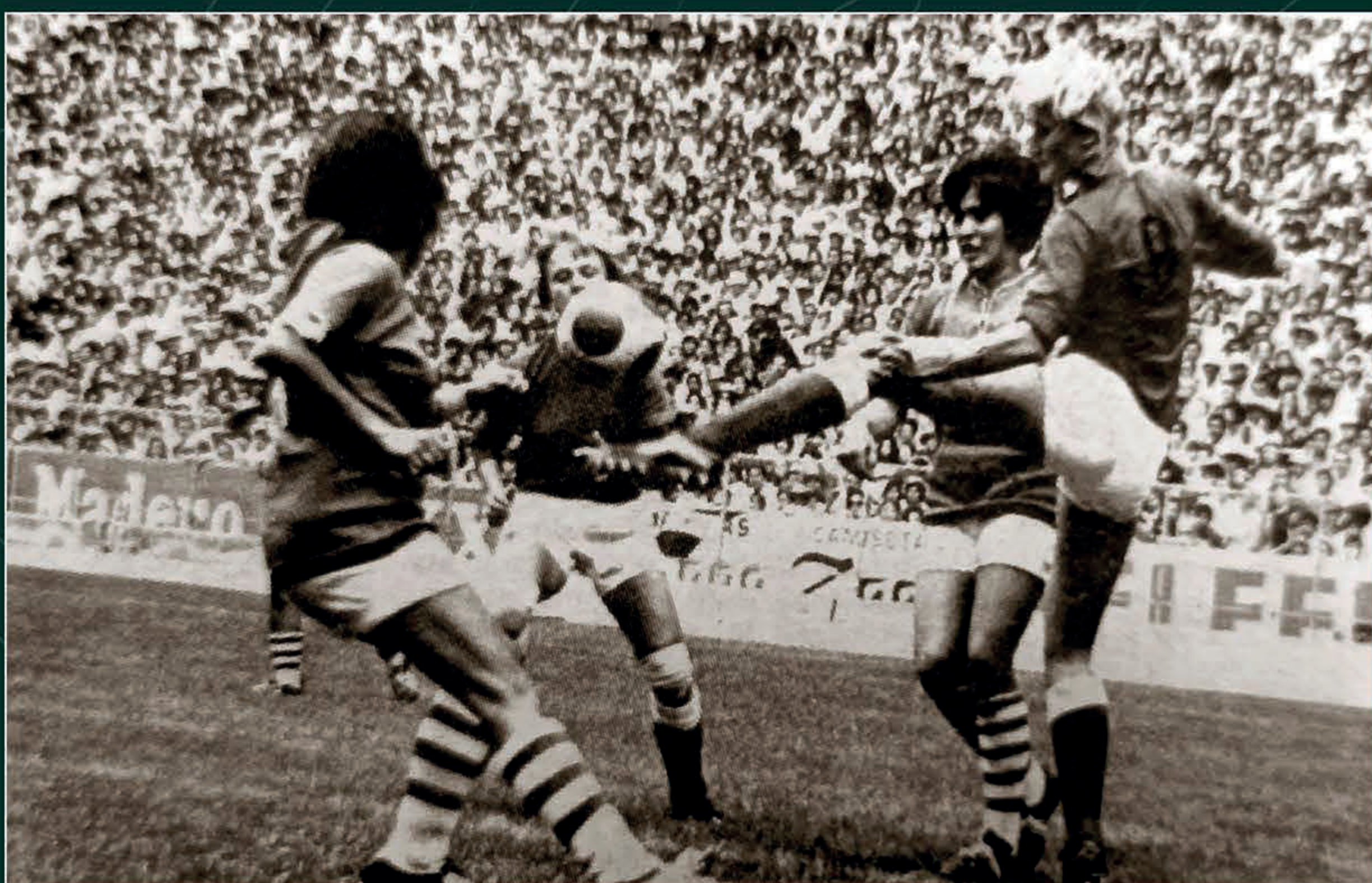
México contra Dinamarca en la gran final. Ovaciones , lunes 6 de septiembre de 1971, p. 3. Hemeroteca Nacional-UNAM.