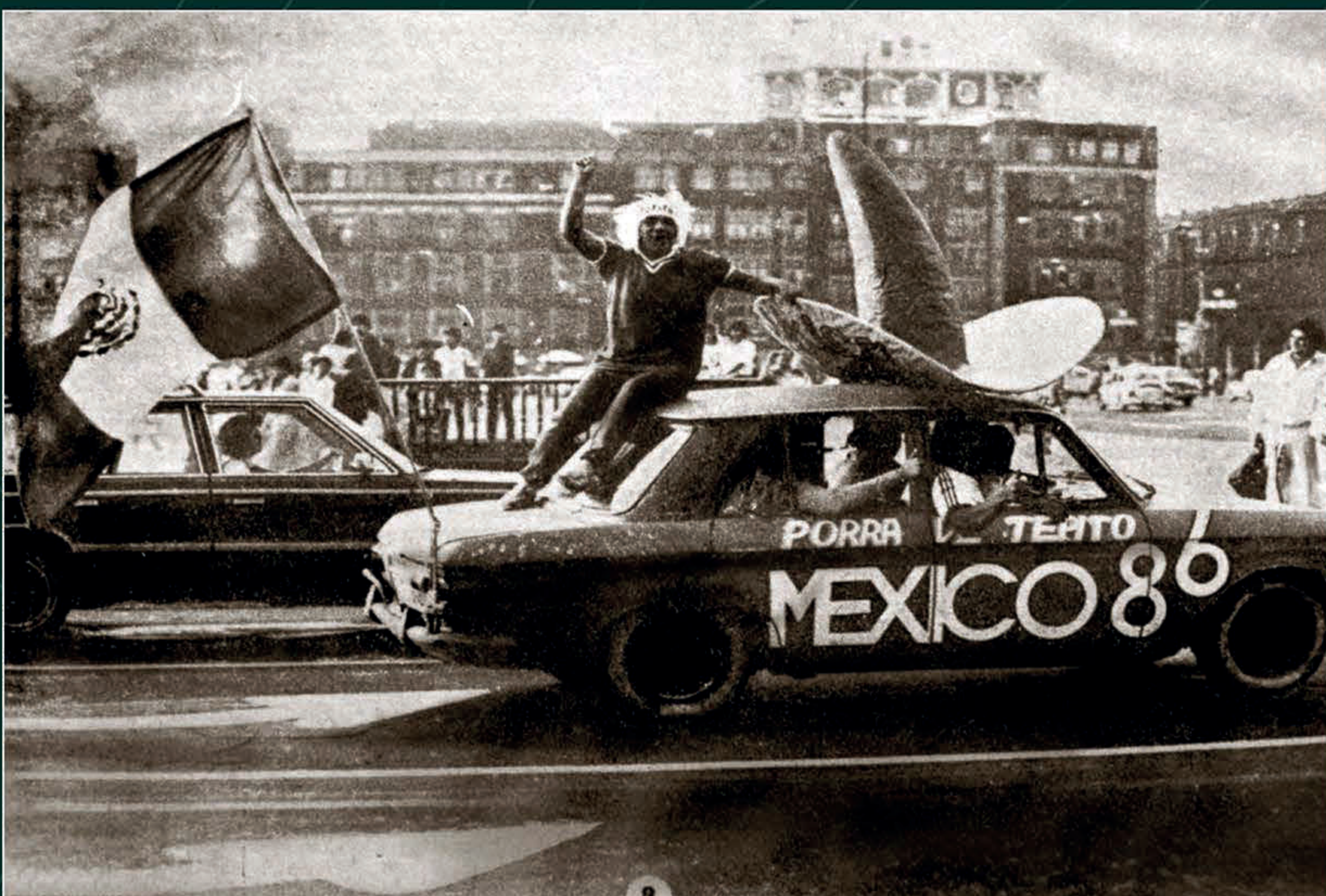
"El festejo en la ciudad después del triunfo sobre Bélgica", El Heraldo de México , 4 de junio de 1986. Biblioteca Miguel Lerdo de Tejada.