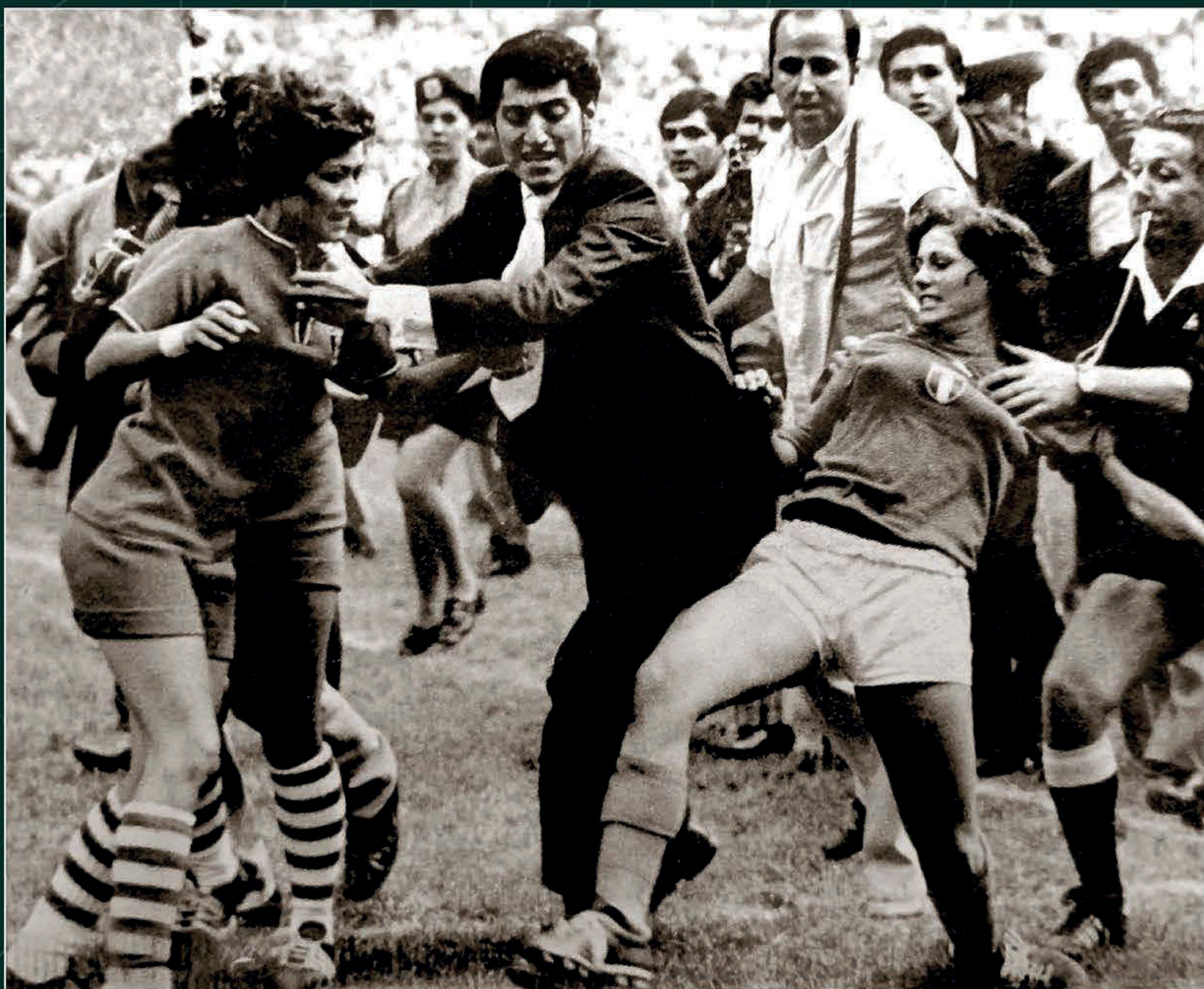
¿Dónde quedó la cabeza? Ovaciones , lunes 30 de agosto de 1971, p. 1. Hemeroteca Nacional-UNAM.

Ante un lleno histórico en el Estadio Azteca, las mexicanas se midieron ante las campeonas vigentes. A pesar del esfuerzo, y del apoyo ensordecedor de la afición, la solidez del conjunto danés se impuso con un marcador final de 3-0.