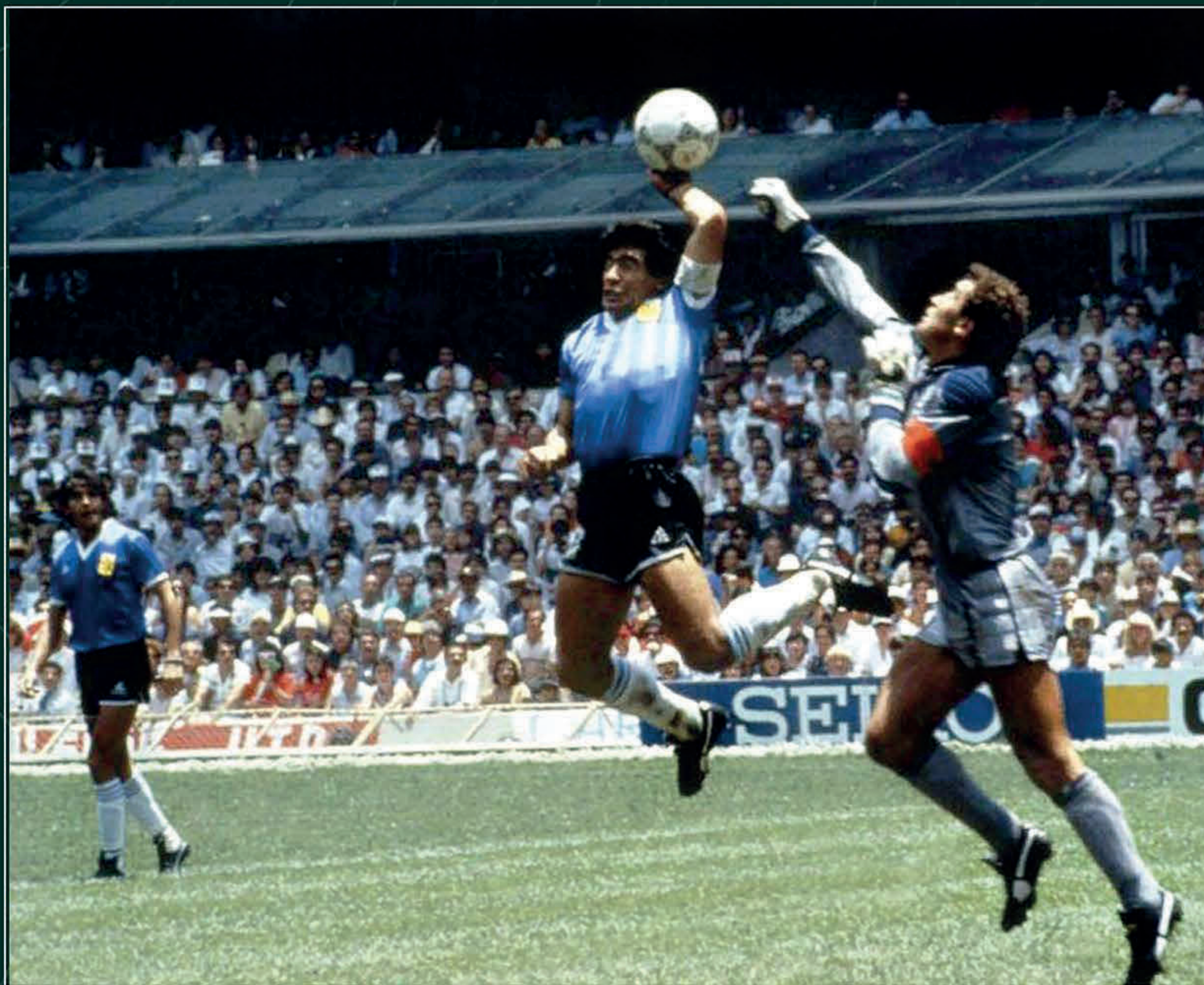
"Maradona, la figura de México 86", El Heraldo de México , 22 de junio de 1986. Biblioteca Miguel Lerdo de Tejada.