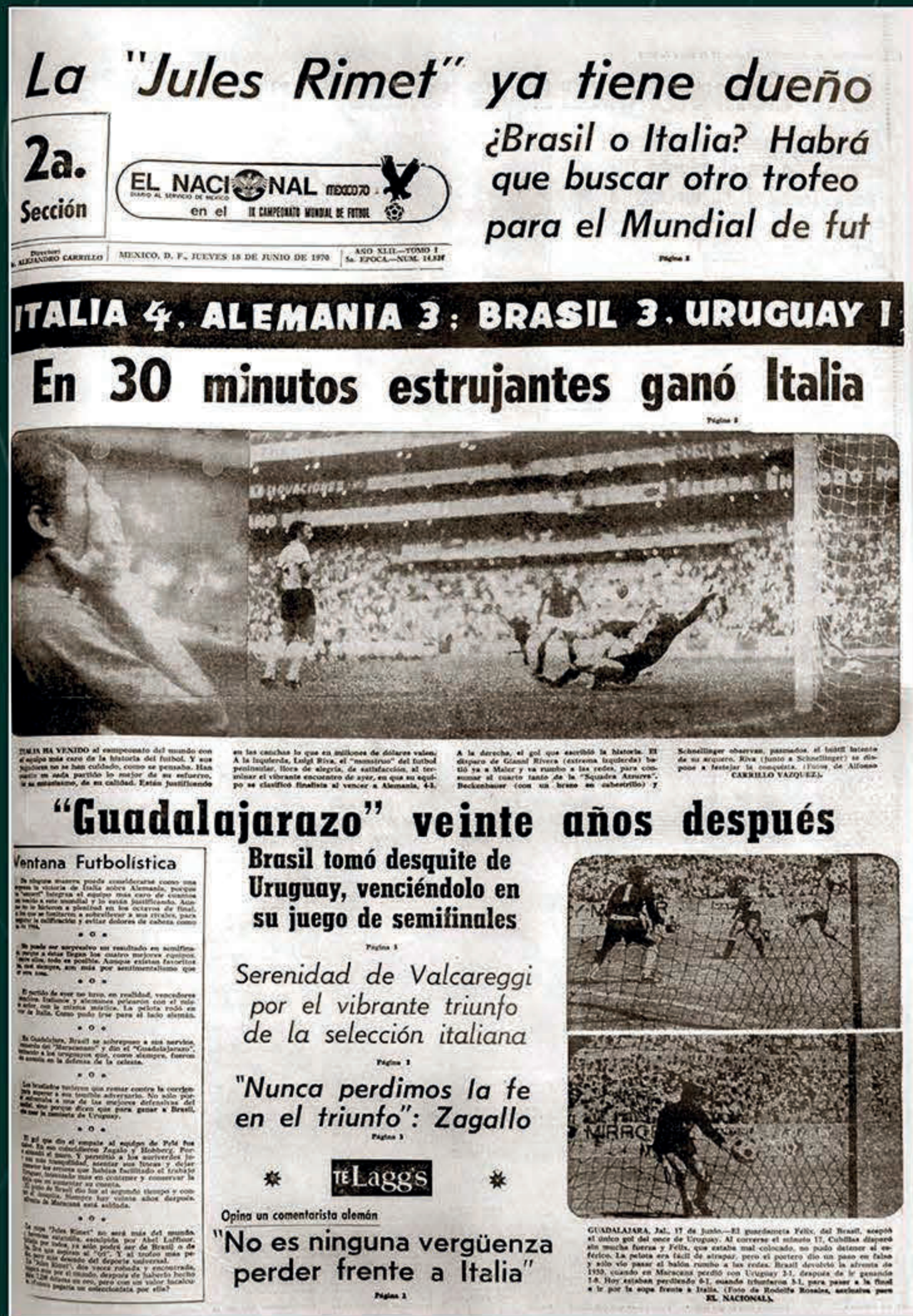
"En 30 minutos estrujantes ganó Italia", El Nacional , 13 de junio de 1970. Biblioteca Miguel Lerdo de Tejada.

Con un marcador final de 4-3, a favor de La Azzurra, y la imagen eterna del capitán alemán Franz Beckenbauer jugando con el brazo en cabestrillo después de lesionarse, aquel encuentro trascendió el deporte para volverse leyenda del fútbol mundial.