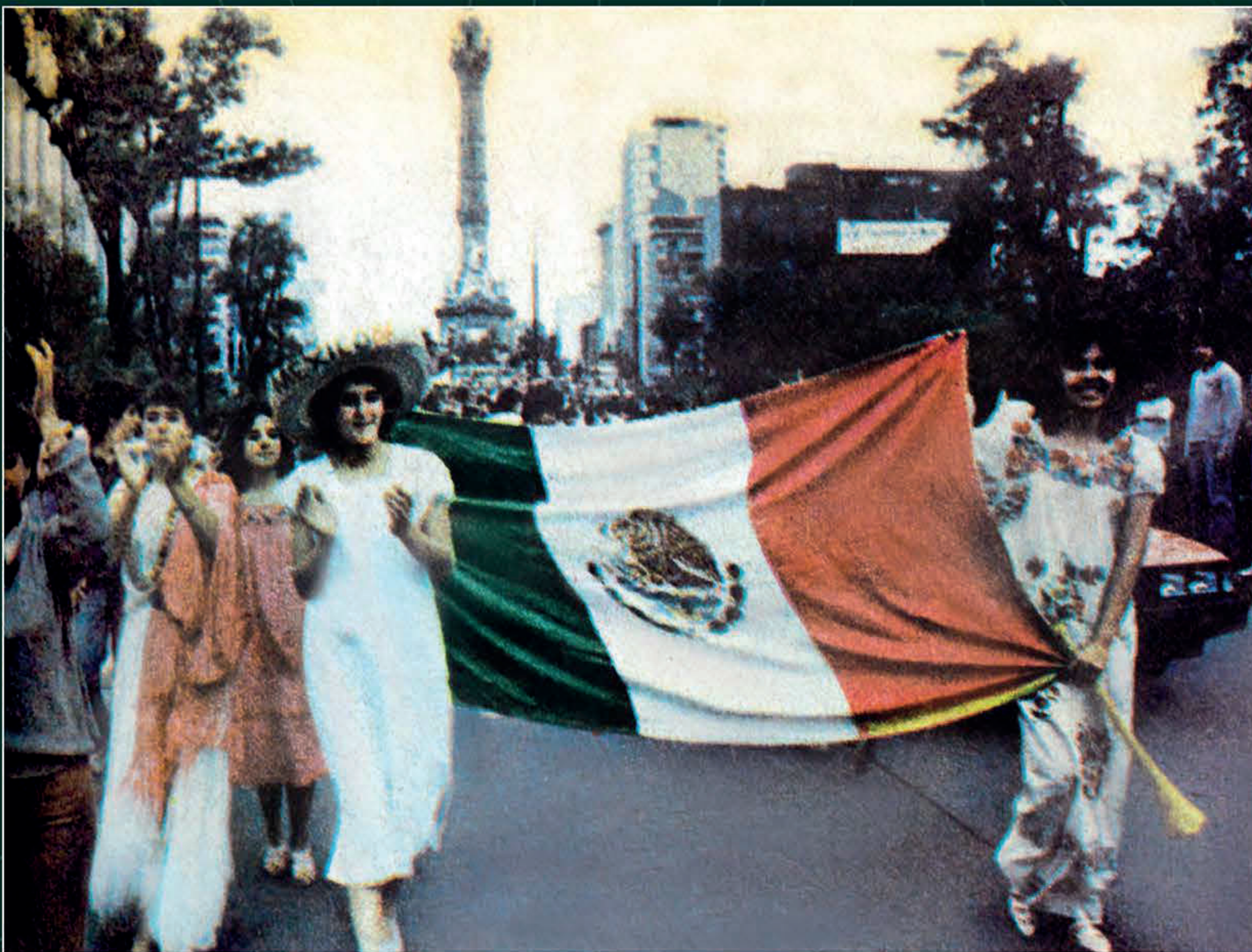
"Aficionados apoyaron al equipo mexicano hasta el final", El Heraldo de México , miércoles 4 de junio de 1986. Suplemento Mundial 86 , p. 1.

Participaron 24 equipos que reunieron a un conjunto de estrellas de la época: Hugo Sánchez en la selección mexicana, Michel González y Emilio Butragueño en el conjunto español; Michel Platini en el equipo francés; Sócrates, Careca y Zico en la selección brasileña; Enzo Francescoli con la camiseta de Uruguay; Michael Laudrup representando a Dinamarca, la selección que se convertiría en la revelación del torneo; Karl-Heinz Rummenigge y Lothar Matthäus en el equipo alemán, campeón mundial defensor; Jorge Valdano y Daniel Pasarella en el combinado argentino. Pero, por encima de todos, el Mundial de México 1986 quedó asociado a una figura y un nombre: Diego Armando Maradona.