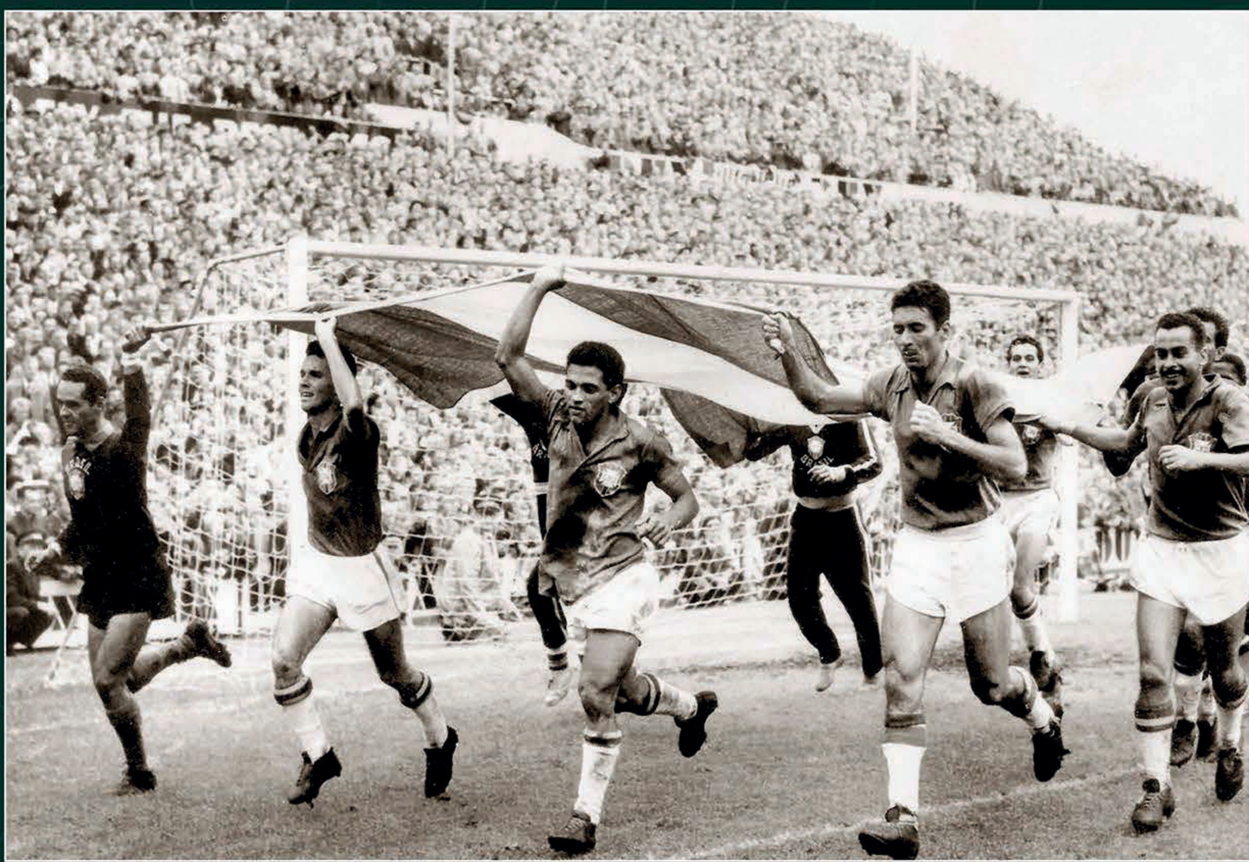
Jugadores de la selección de Brasil dan la vuelta olímpica tras ganar el Mundial de Fútbol en Suecia 58. 29 de junio de 1958.

Durante este periodo, México se convirtió en un invitado recurrente que, tras años de aprendizaje, logró en Chile 1962 su histórica primera victoria ante Checoslovaquia. Estas décadas previas, que culminaron con la sobriedad táctica de Inglaterra 1966, sentaron las bases técnicas y populares para que el fútbol diera el salto definitivo hacia la modernidad y el espectáculo global que definiría la cita mexicana.