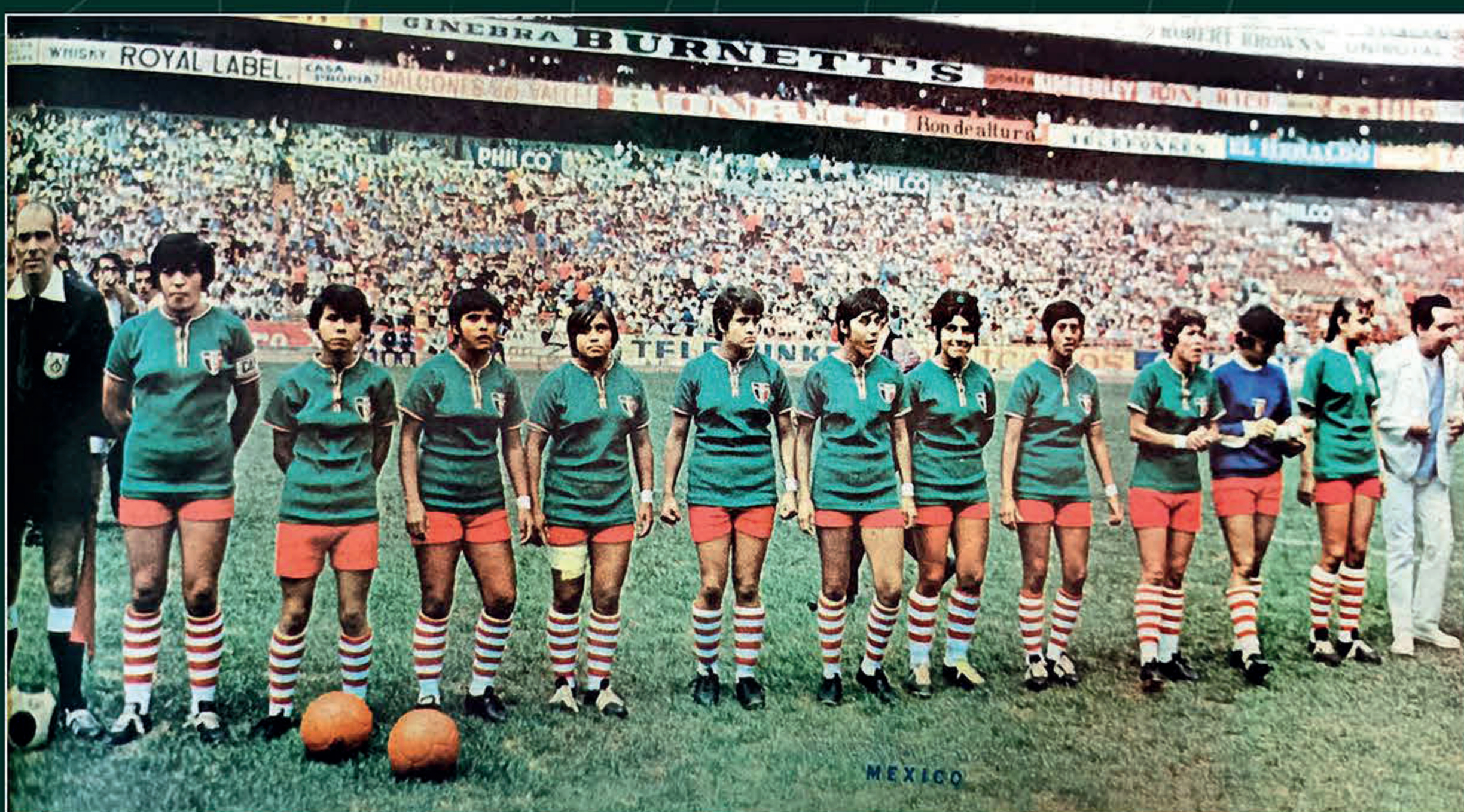
La selección femenil de fútbol. El Heraldo de México , lunes 6 de septiembre de 1971, p. 1-B. Hemeroteca Nacional-UNAM.

Aquel verano de 1971, la selección mexicana femenil no sólo ganó una medalla de plata; sembró la semilla de la ilusión y perseverancia que, décadas más tarde, permitiría que el fútbol femenino en México fuera finalmente reconocido de manera oficial.