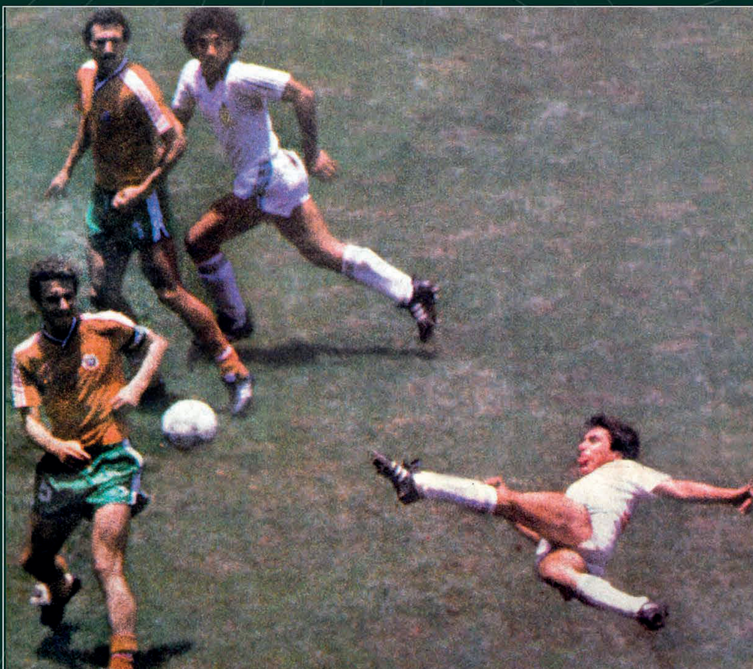
"Mañana México por su pase", El Heraldo de México , 20 de junio de 1986. Biblioteca Miguel Lerdo de Tejada.