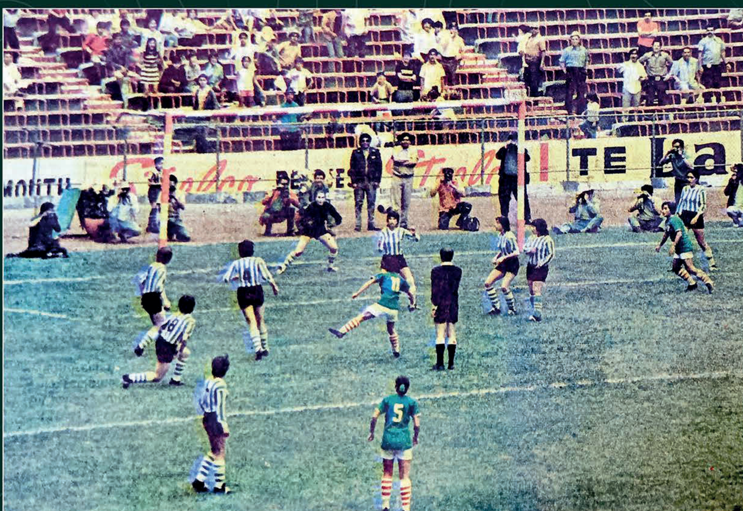
México contra Argentina. El Herald de México , 16 de agosto de 1971, p. 8-B. Hemeroteca Nacional-UNAM.

Las canchas de Guadalajara y la capital del país fueron los escenarios donde se desarrolló esta justa deportiva. Aunque el torneo no estaba organizado ni reconocido por la FIFA , generó gran expectación en la prensa y los medios de comunicación, así como entre el público que abarrotó los estadios para todos los partidos. En el partido inaugural las mexicanas se impusieron 3-1 a la selección de Argentina.