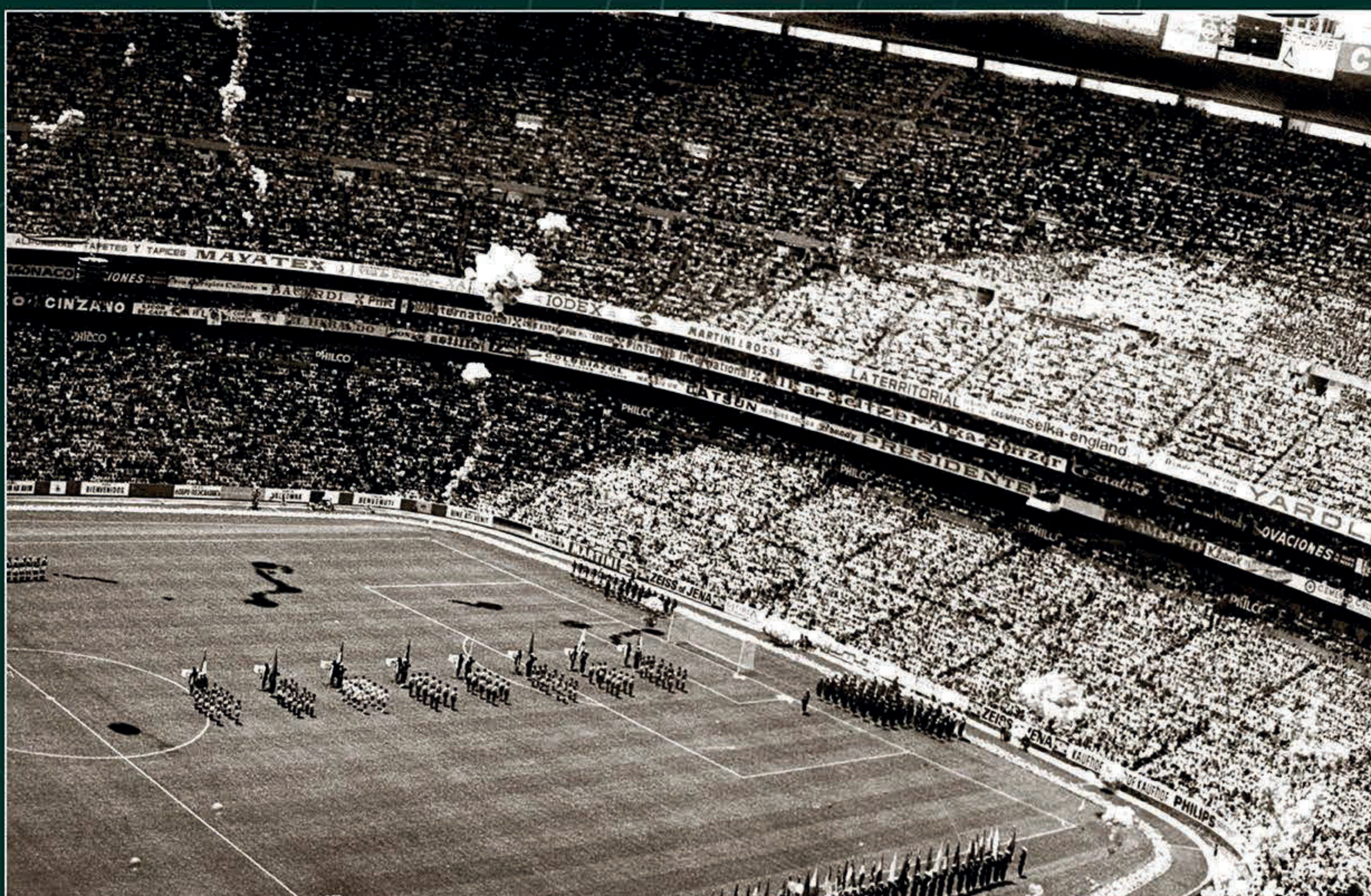
Escena de la ceremonia de inauguración del Mundial de Fútbol México 1970. 1o. de junio de 1970.

En 1986 el país hizo historia al convertirse en el primero en repetir como sede, asumiendo el reto tras la renuncia de Colombia. Este dominio organizativo alcanzará un nuevo nivel histórico el próximo 11 de junio de 2026: ese día, el Estadio Azteca se consolidará como el único recinto en el planeta con cuatro partidos inaugurales de campeonatos mundiales de fútbol varonil y femenino.