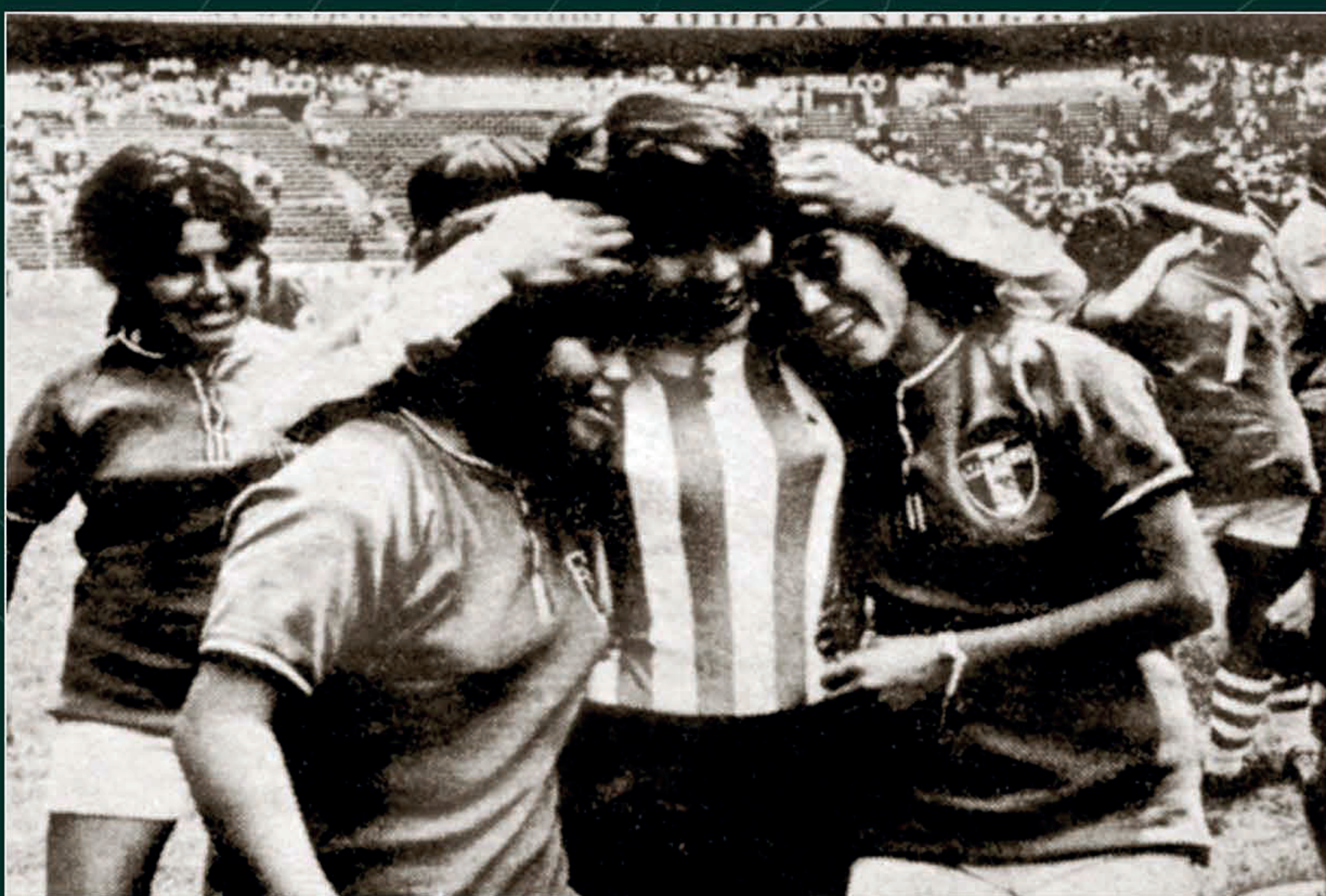
"Porras, risas y llanto", Esto , 16 de agosto de 1971. Biblioteca Miguel Lerdo de Tejada.