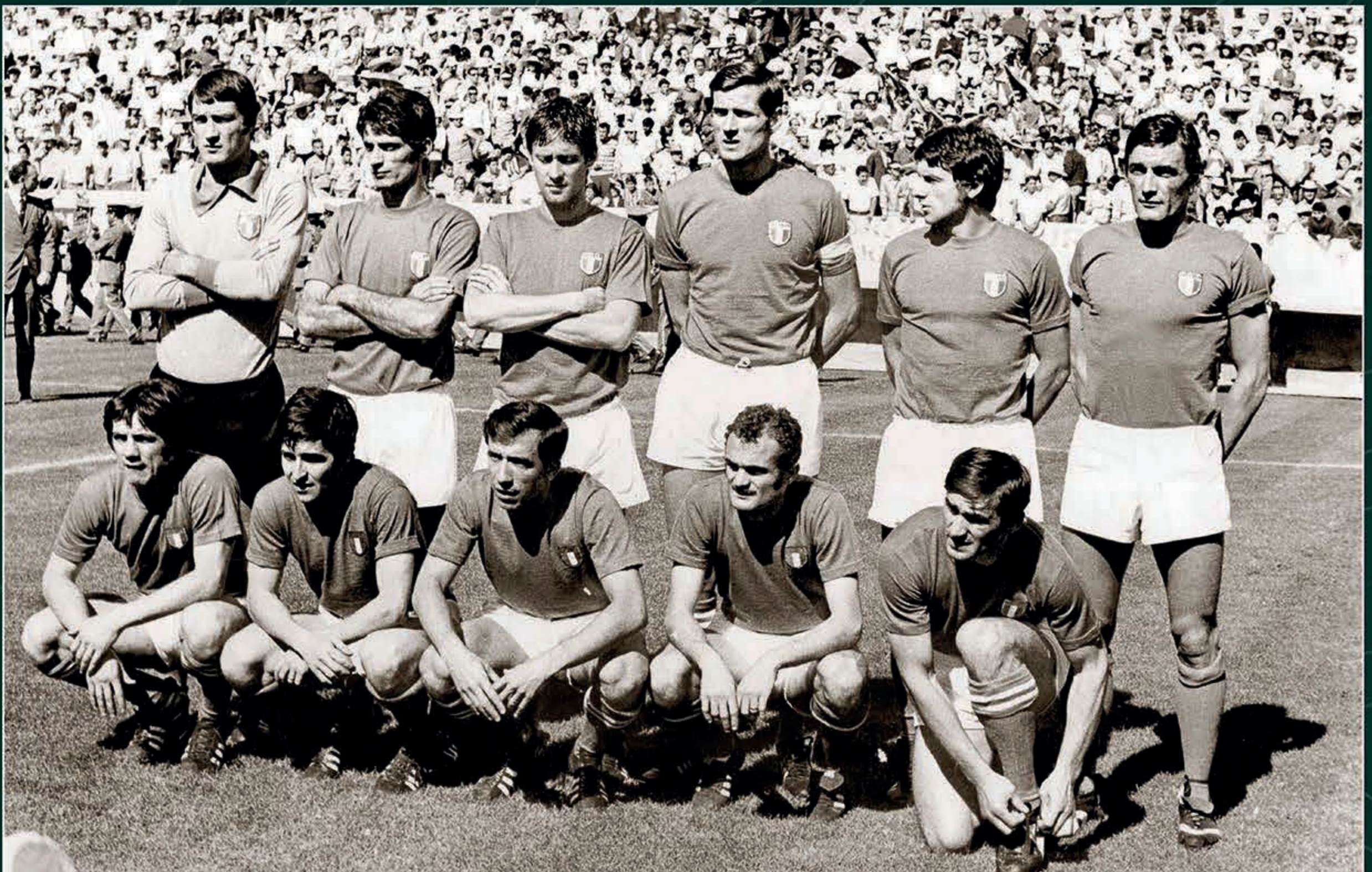
Selección de Italia antes de su partido contra la Selección Mexicana de Fútbol. 14 de junio de 1970.