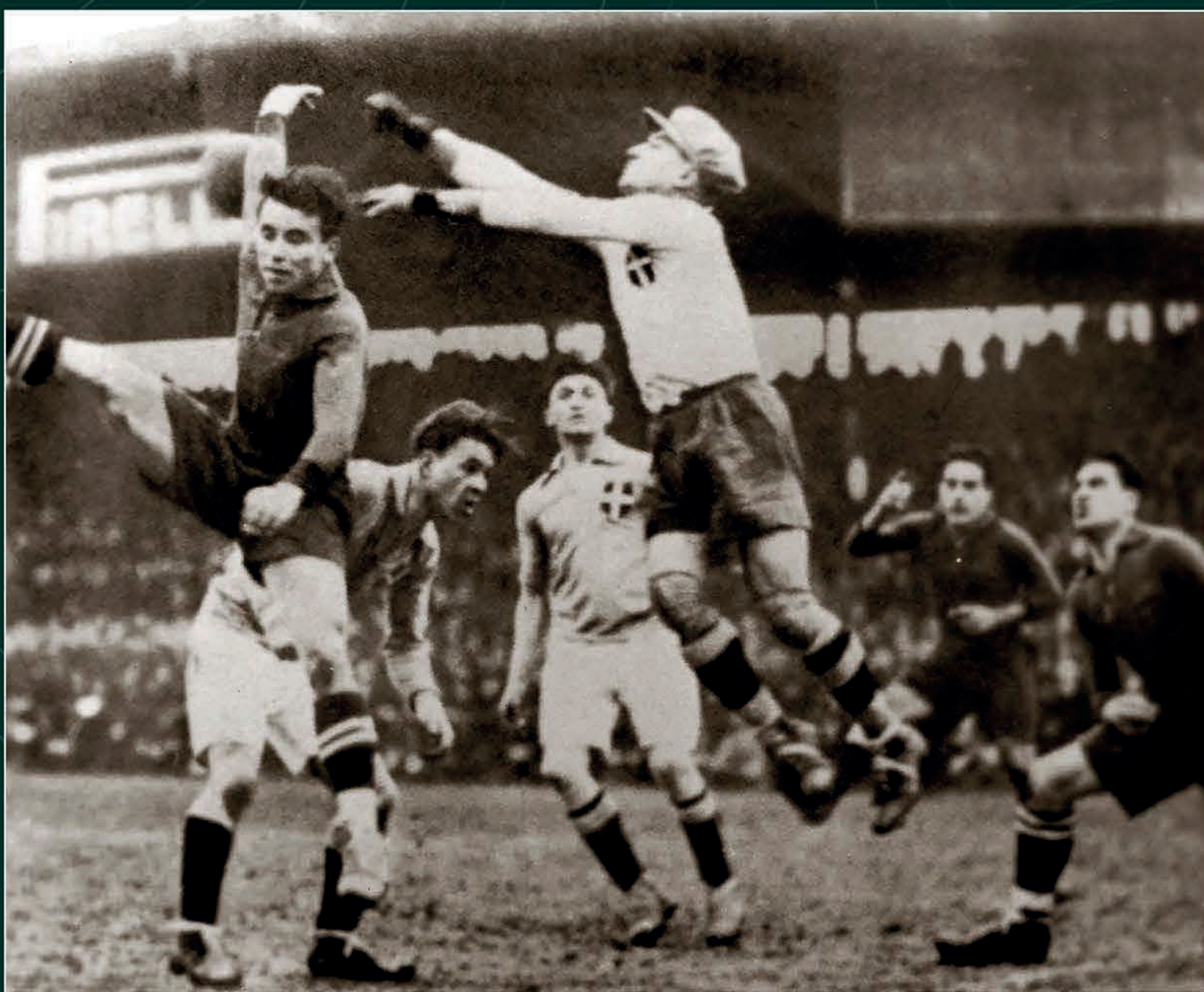
Partido de la Copa del Mundo Italia 1934 (Probablemente Suecia contra Argentina), 27 de mayo de 1934.

D urante la primera mitad del siglo xx, el futbol trascendió los colegios y clubes de la élite comercial y política para arraigarse en los sectores populares y obreros de Europa y América Latina. Este proceso de democratización deportiva impulsó la creación de ligas profesionales y dio origen, en 1930, al primer Campeonato Mundial en Uruguay. Desde aquella edición, el torneo se ha celebrado de forma cuatrienal, con excepción de 1942 y 1946, años en los que la Segunda Guerra Mundial obligó a suspender la competencia.