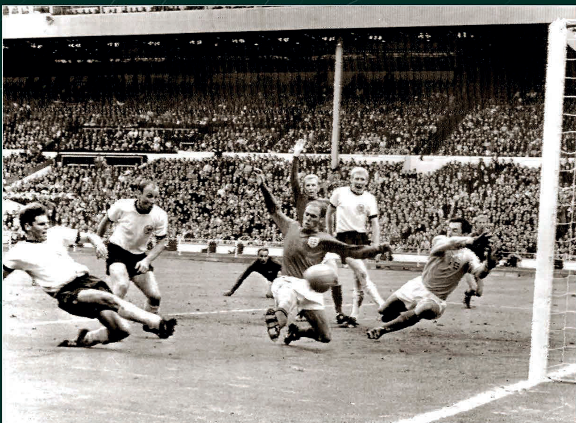
Gol de Alemania Federal en la final de la Copa Mundial de Fútbol Inglaterra 1966.