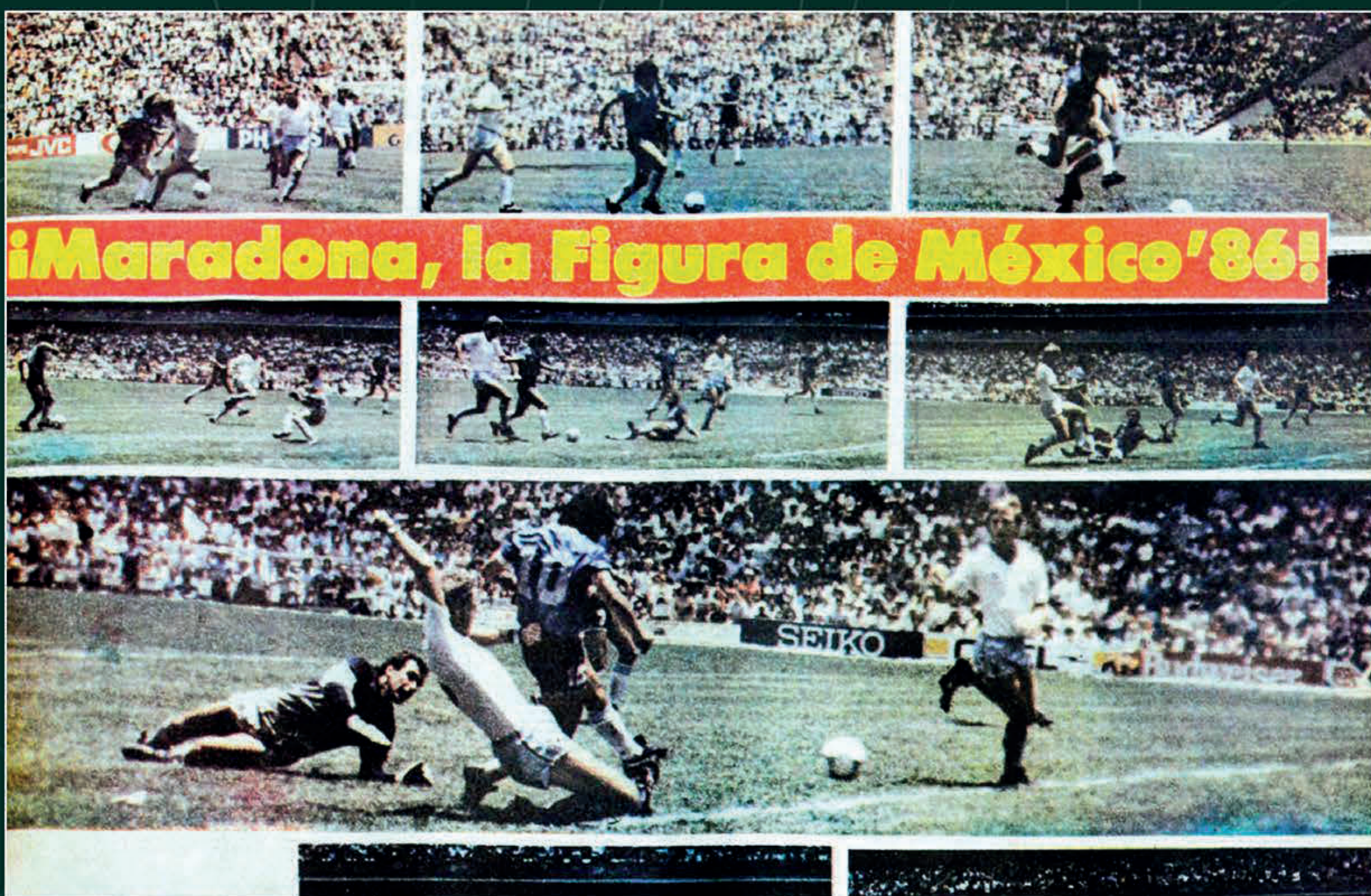
"Maradona, la figura de México 86", El Heraldo de México , 22 de junio de 1986. Biblioteca Miguel Lerdo de Tejada.

Aquella tarde, Maradona no sólo eliminó a Inglaterra, sino que transformó el encuentro en una reivindicación simbólica, elevando el fútbol a una dimensión mística y política que resonó como un desahogo histórico para toda una nación.