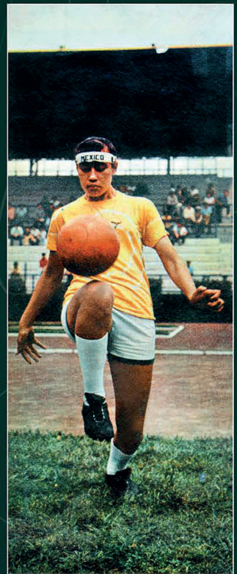
“Las mariscalas de los equipos femeniles de México e Italia”, Esto. Suplemento dominical , 29 de agosto de 1971. Biblioteca Miguel Lerdo de Tejada.