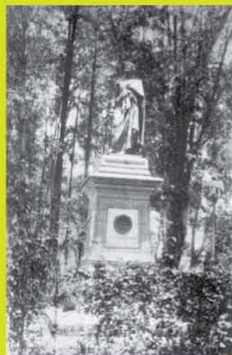
Estatua de Guerrero en el Panteón de San Fernando, en el DF.