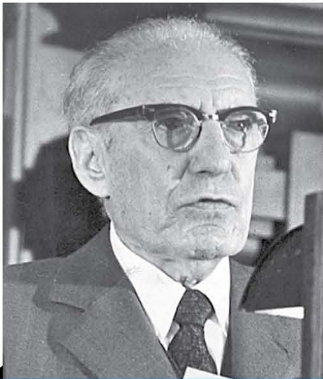
Martín Luis Guzmán se exilió luego de su adhesión delahuertista.