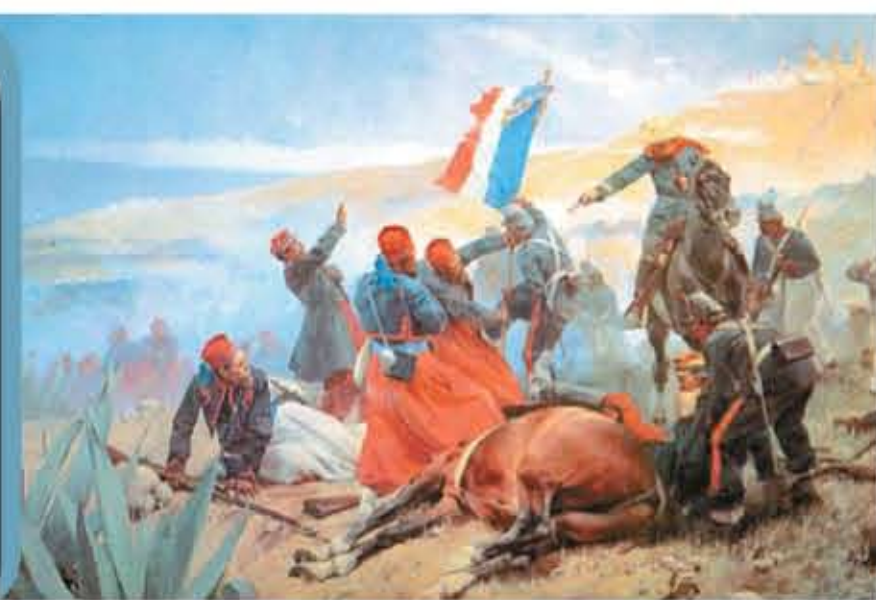
La Batalla de Puebla captada por José Chuscas. Imagen MNH-INAH.